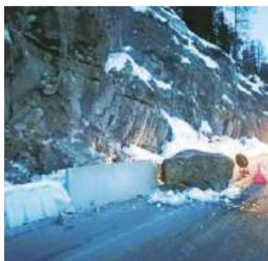
Il masso caduto vicino Palafavera