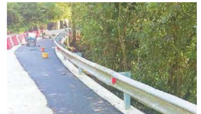
Il tratto di via Col Cavalier sistemato nel 2017

BELLUNO. Sarà completata quest'anno la messa in sicurezza di via Col Cavalier. La strada che porta a Castion presenta un cedimento significativo che sarà risolto con un consolidamento. Un primo stralcio dell'intervento è stato fatto nel 2017, quest'anno il lavoro sarà completato. La giunta ha approvato il progetto il 12 dicembre dello scorso anno e lo ha messo nella programmazione 2019.